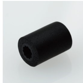
フォームタイプイヤークーピース